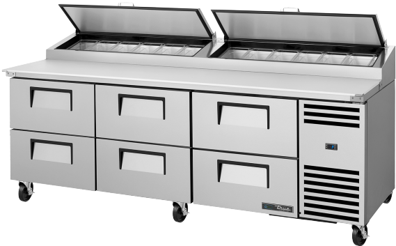
Table de préparation de pizza, 12 bacs GN 1/3, 6 tiroirs