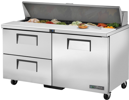
Table de préparation, 16 bacs GN 1/6, 2 tiroirs + 1 porte battante pleine